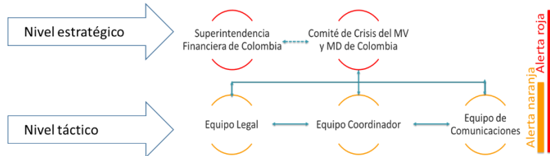
Gráfico 1 - Estructura de Gobierno